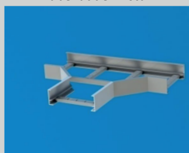
kabelladder T stuk